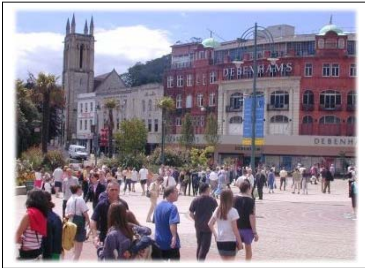
Centro de la Ciudad